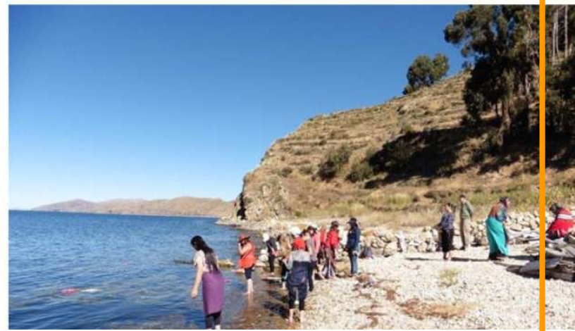
Isla del Sol – Lago Titicaca – Bolivia