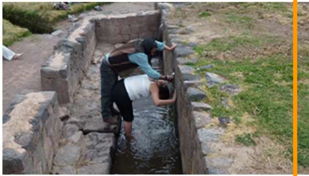
Templo del Sol – Wiracocha