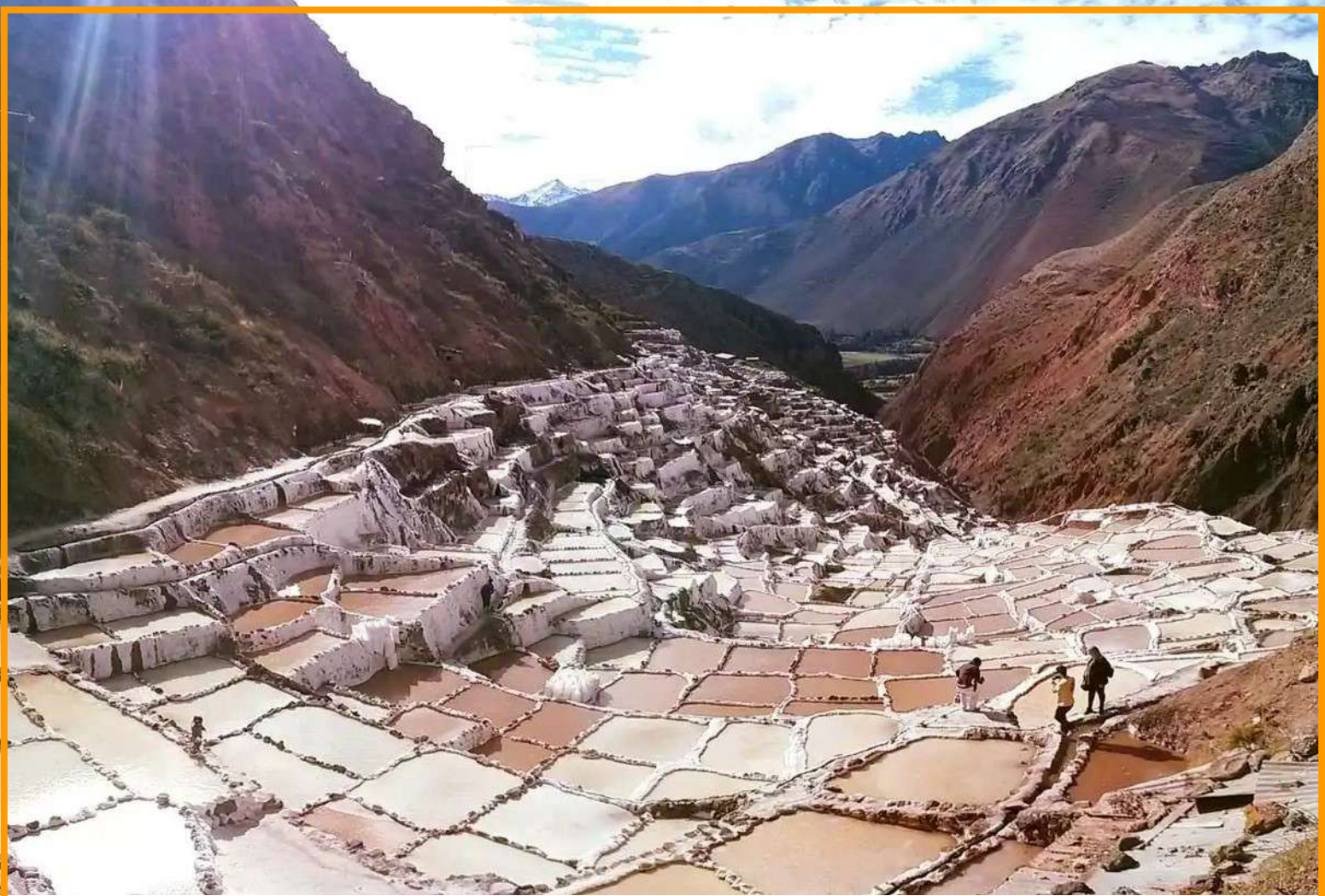
Salineras de Maras