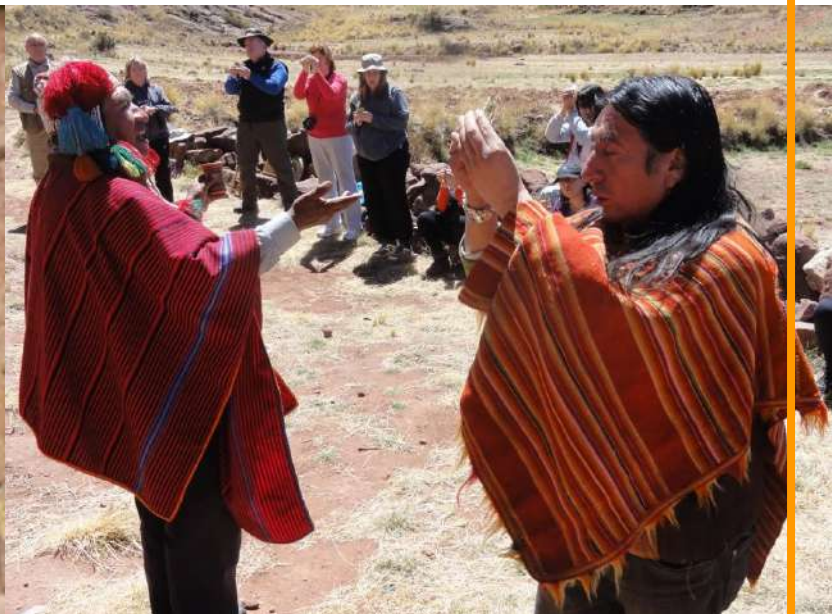
Portal Interdimensional de Aramu Muru