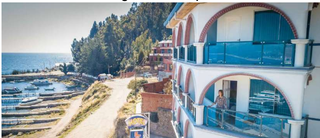
Hotel Lago Azul