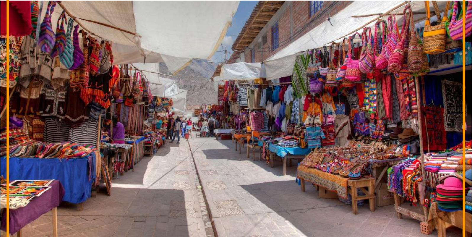
Mercado de Pisac