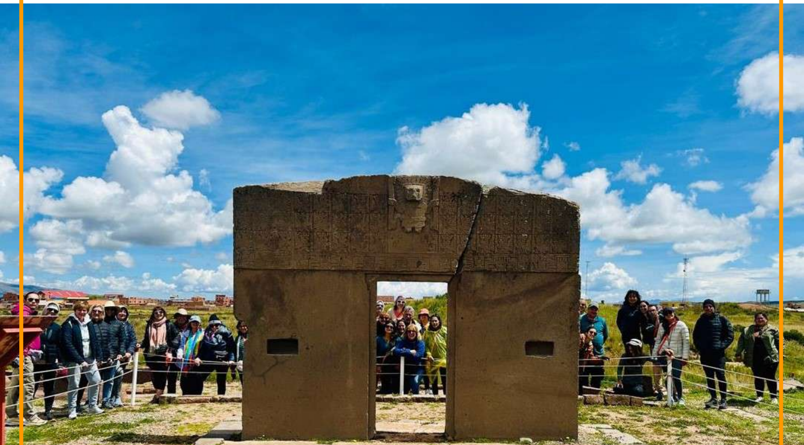
Puerta del Sol – Bolivia