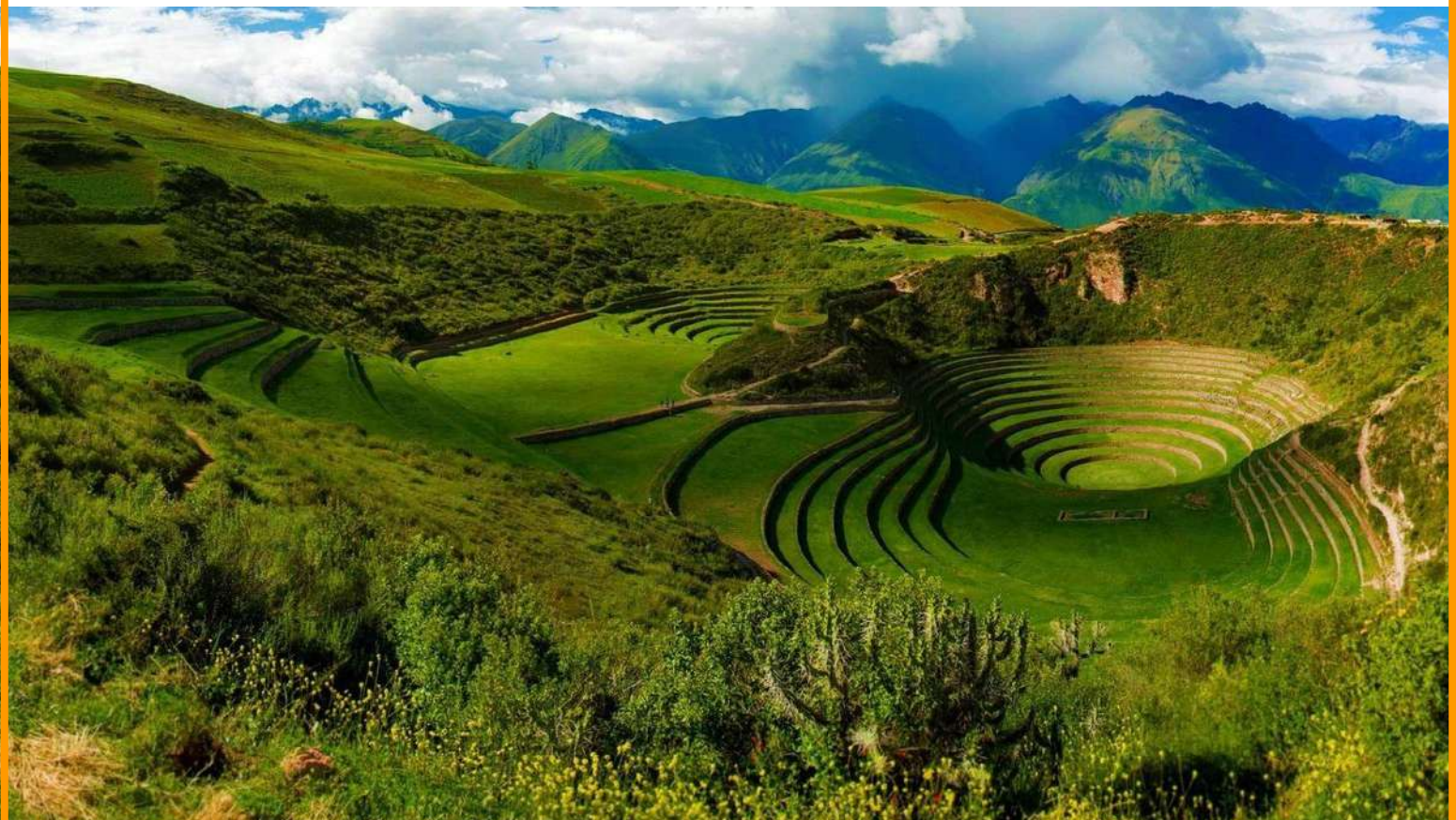
Zona Arqueológica de Moray