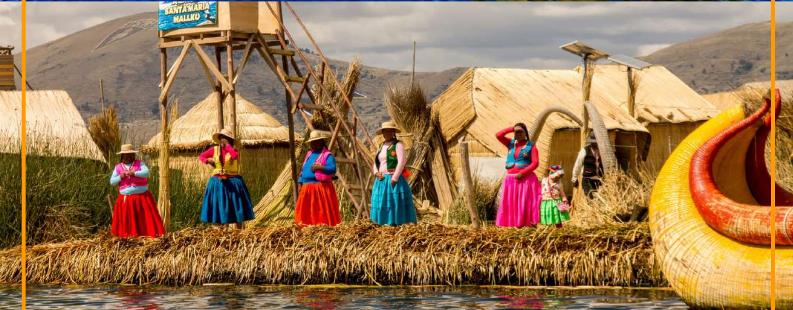
Islas Flotantes de los Uros – Lago Titicaca – Perú